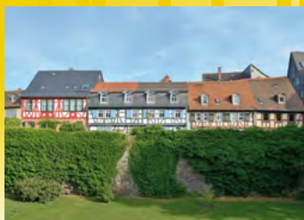
Frankfurt-Höchst, Stadtansicht