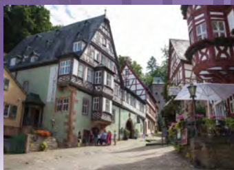
Miltenberg, Marktplatz „Schnatterloch“