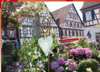
Kirchheim unter Teck

Stadt Herrenberg Marktplatz 5 Fon: 07032/924-0 Fax: 07032/924-390