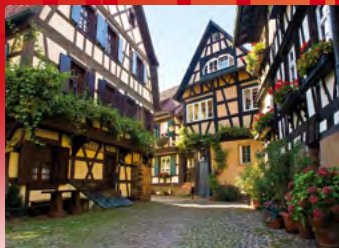
Gengenbach, Engelgasse