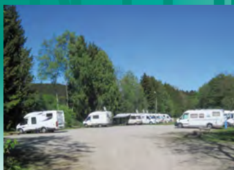
Osterode am Harz, Campingplatz Eulenburg