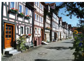
Lauterbach, Fachwerk „Am Graben“