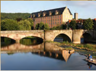
Hann.Münden, Werrabrücke