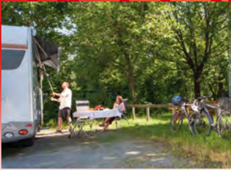
Biberach a. d. Riß