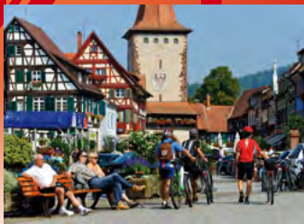
Gengenbach, Obertor

Kultur- und Tourismus GmbH Gengenbach Im Winzerhof Fon: 07803/930143 Fax: 07803/930142