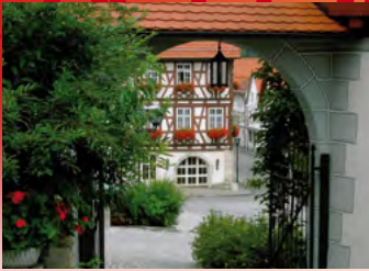
Trochtelfingen, Blick auf das Gasthaus Zum Ochsen