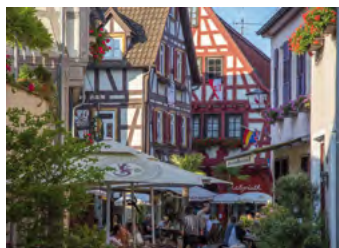
Besigheim, Kirchstraße