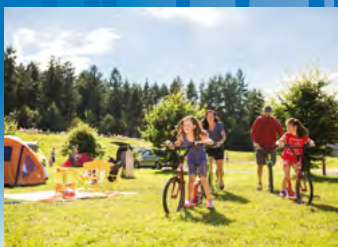
Großschönau, TRIXI Ferienpark