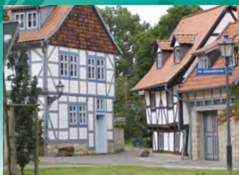
Halberstadt, Grauer Hof

Tourist-Information Einbeck Marktstraße 13 Fon: 05561/313-1910