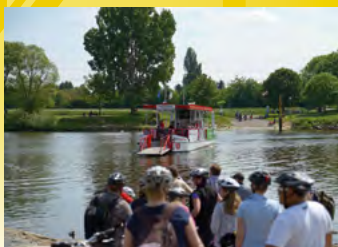
Frankfurt-Höchst, Fähre am Mainufer

Tourismus+Congress GmbH 60329 Frankfurt am Main Kaiserstraße 56 Fon: 069/21238800 Fax: 069/21237880