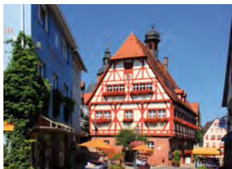
Walldürn, Blick auf das hist. Rathaus