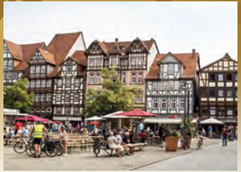
Hann.Münden, Fachwerk

Hann. Münden Marketing GmbH Rathaus/Lotzestraße 2 Fon: 05541/75-313 und 75-343 Fax: 05541/75-404