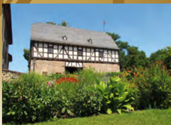
Homberg (Ohm), Burgkapelle St. Georg

Tourist Information Marktplatz 19 Fon: 05681/939161 Fax: 05181/939162