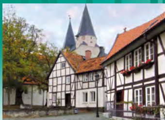
Königsutter am Elm