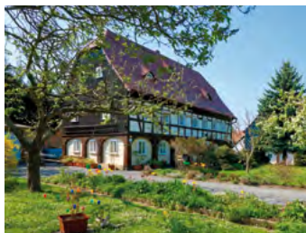
Kottmar OT Obercunnersdorf