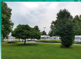
Stadthagen, Reisemobilstellplatz am Freizeitbad Tropicana