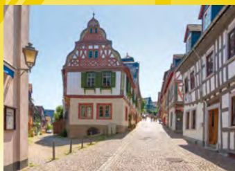
Idstein, Obergasse

Tourist-Info Idstein König-Adolf-Platz Fon: 06126/78-620 Fax: 06126/78-865