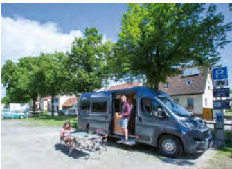
Kirchheim unter Teck