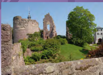
Stadt Dreieich, Burg Hayn Dreieichenhain

Stadt Dreieich Hauptstraße 45 Fon: 06103/601-681 Fax: 06103/601-8681