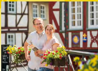
Wetzlar, Touristen am Kornmarkt

Tourist-Information Domplatz 8 Fon: 06441/997755 Fax: 06441/997759