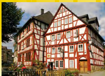
Dillenburg, Hüttenplatz, Schwarzer Adler