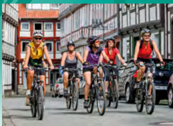
Osterode am Harz, Historische Altstadt

Touristinformation Eisensteinstraße 1 Fon: 05522/318333 Fax: 05522/318380