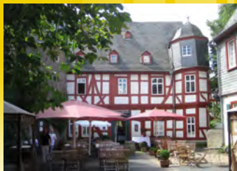
Herborn, Hohe Schule