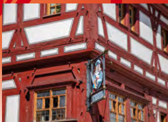
Bönningheim, Ratsstüble

Stadt Bönningheim Kirchheimer Straße 1 Fon: 07143/273-0 Fax: 07143/273-153