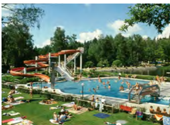
Seifhennersdorf, Wald- und Erlebnisbad

Stadt Seifhennersdorf Rathausplatz 1 02782 Seifhennersdorf Wald- und Erlebnisbad „Silberteich“ (Fon: 03586/405040) bad@seifhennersdorf.de