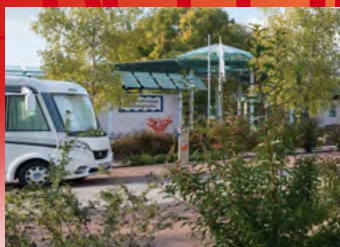
Bönningheim, Stellplatz am Mineralfreibad