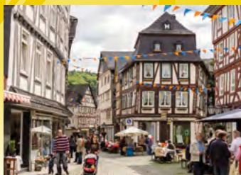
Dillenburg, Altstadt, Fußgängerzone

Tourist-Information Hauptstraße 19 Fon: 02771/896151 Fax: 02771/896159