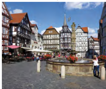
Fritzlar, Marktplatz