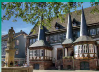
Einbeck, Altes Rathaus