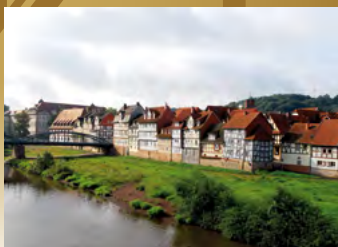
Rotenburg, Partie an der Fulda

Kultur- & Tourist-Info Fon: 05661/708-200 Fax: 05661/708-210