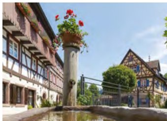
Schiltach, Brunnen in der Gerbergasse