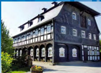
Ebersbach-Neugersdorf, Alte Mangel