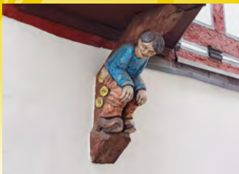
Herborn, Schatzhaus, Hauptstraße

Stadtmarketing Herborn GmbH Bahnhofplatz 1 Fon: 02772/708-1900 Fax: 02772/708-9190