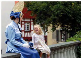
Pfullendorf, Blickfang örtliche Tracht