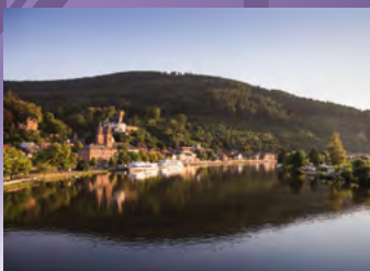
Miltenberg, Blick auf Miltenberg

Tourismusgemeinschaft Miltenberg Bürgstadt Kleinheubach Engelplatz 69 Fon: 09371/404119 Fax: 09371/9488944