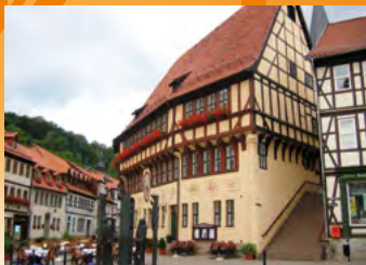
Südharz OT Stolberg, Rathaus

Tourist-Information Auer Gasse 6-8 Fon: 03683/6097580 Fax: 03683/60975821