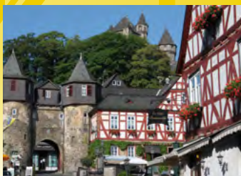
Braunfels, Altstadtensemble am Marktplatz

Touristinformation Bad Camberg Chambray-lès-Tours-Platz 2 Fon: 06434/202411 und 202412 Fax: 06434/202414