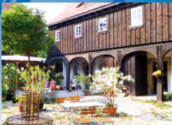
Ebersbach-Neugersdorf, Kaffeemuseum, Hofansicht

Stadtverwaltung Ebersbach-Neugersdorf Reichsstraße 1 Fon: 03586/763107 Fax: 03586/763190