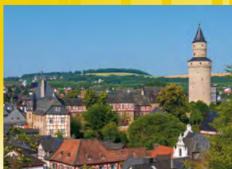
Idstein, Stadtimpression